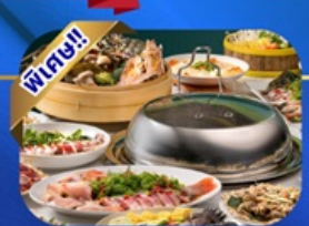
ซูฟไฟชีชาย