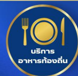
บริการ อาหารท้องถิ่น