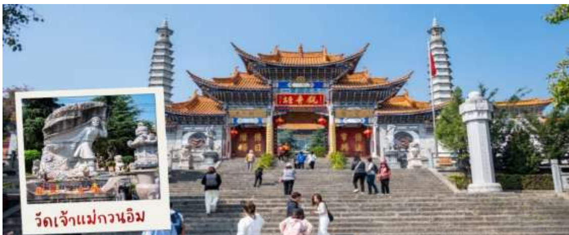
วัดเจ้าแม่กวนอิม