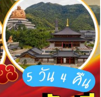
ภูเขาเสวียโต้วซาน