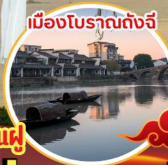
เมืองโบราณถังฉี