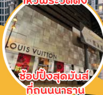
ช้อปปิ้งสุดมันส์ ที่ถนนนคราณ