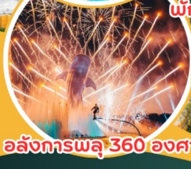
อสังการพลุ 360 องศา