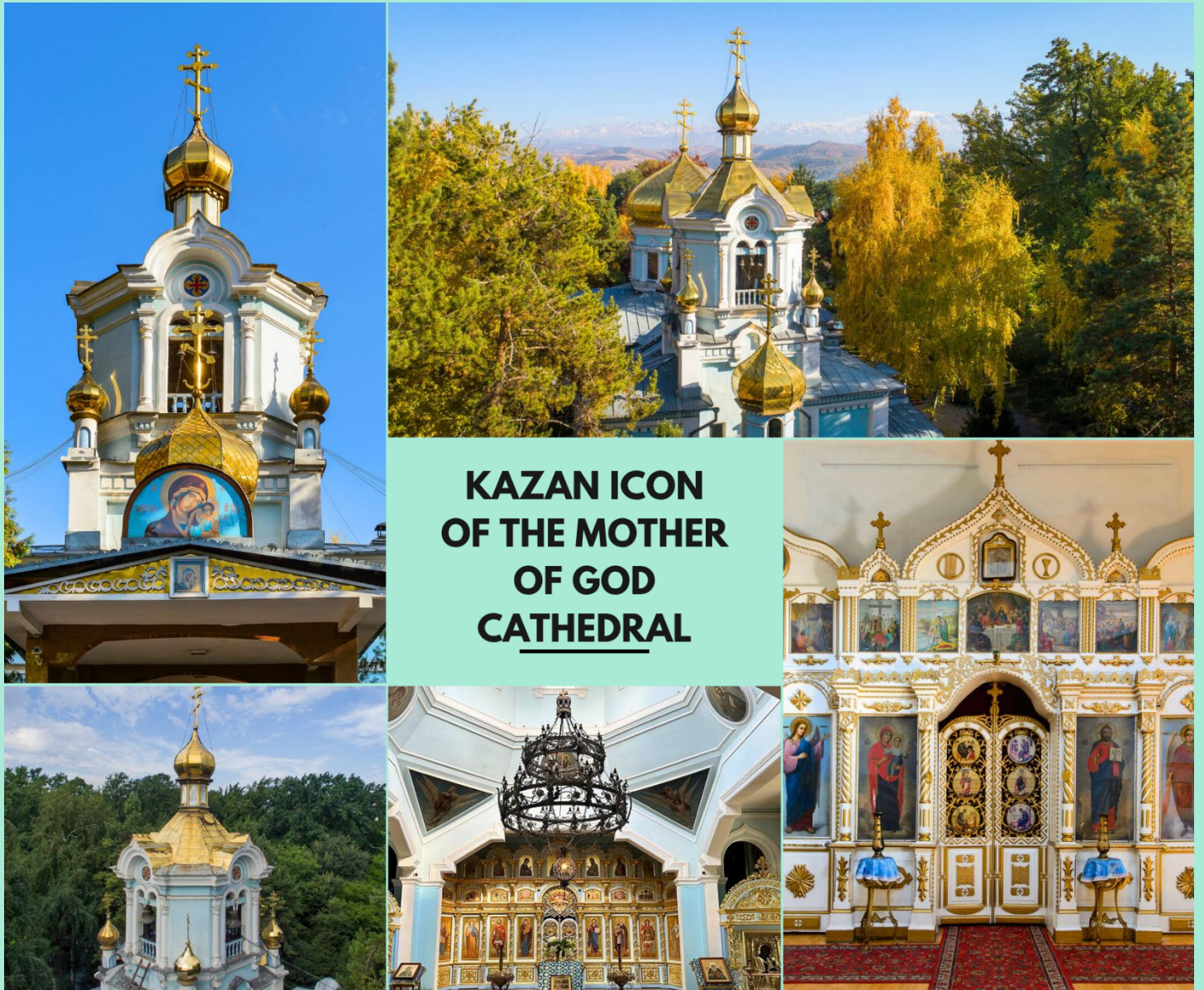
KAZAN ICON OF THE MOTHER OF GOD CATHEDRAL

นำท่านชม โบสถ์ไต่ดินดาซา (Kazan Icon of the Mother of God Cathedral) สภานที่ศักดิ์สิทธิ์ลึกลับไต่ดินแห่ง เมืองอัลมาตีถูกซ่อนอยู่ในถ้ำไต่ดิน สร้างขึ้นโดยฝีมือช่างชาวรัสเซียในช่วงต้นศตวรรษที่ 20 เพื่อเป็นสภานที่ประกอบ พิธีกรรมทางศาสนา ด้านในโบสถ์ตกแต่งด้วยภาพจิตรกรรมของชาวคริสต์นิกายออร์ทอดอกซ์ บรรยากาศเย็นสงบ และ เต็มไปด้วยมนต์ขลัง ( การเปลี่ยนสีของใบไม้ขึ้นอยู่กับสภาพอากาศ )