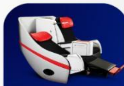
ที่นั่งพรีเมียมแฟลตเบด

บริการอาหารร้อน และ น้ำดื่ม บนเครื่อง ขาไป และ ขากลับ