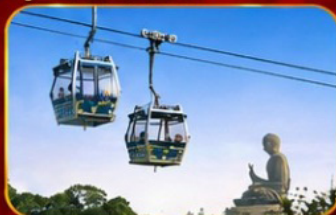
กระเช้านองปิง