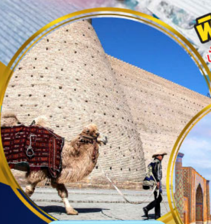
บ่อมปราทาร์บุคาร่า