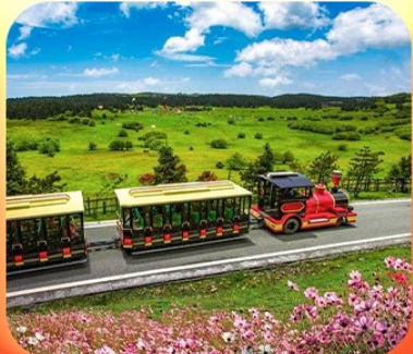
“อุทยานเจานางฟ้า”

บินตรงลงชิง • อุ๋หลง หลุมฟ้าสะพานสวรรค์ • ระเบียบแก้ว • อุทยานเจานางฟ้า หงหยาดัง • นั่งรถไฟทะลุติ๊ก • ล่องเรือชมดวงชิงยามค่ำคืน • ศาลาประชาคม (ด้านนอก) มรดกโลกผาหินแกะสลักต้าจู้ • เมืองโบราณซือปาตี • วัดหลิวฮั่น • ตึกตะเกียบ