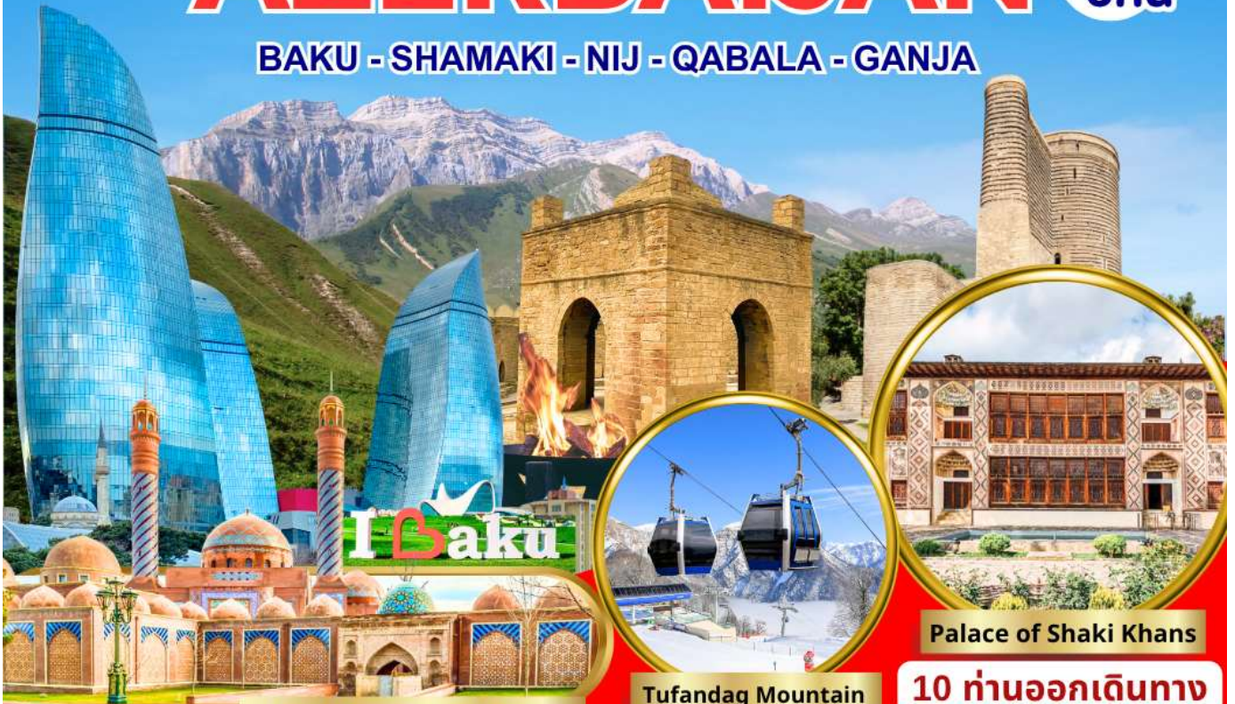
Masjid Imamzadeh Ibrahim