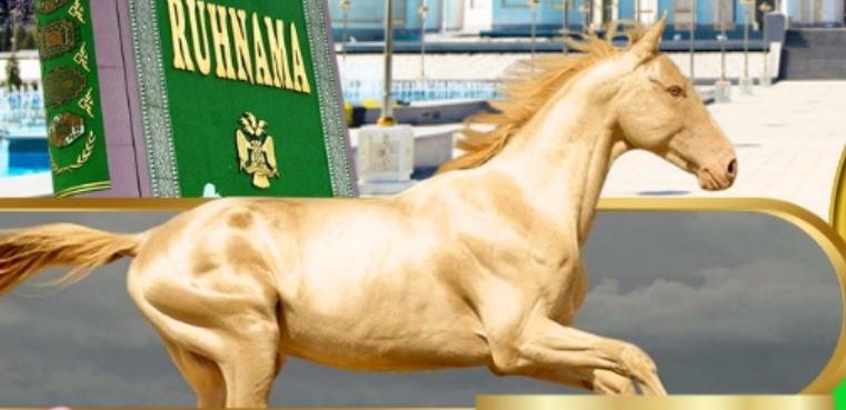
Akhal Teke Horse