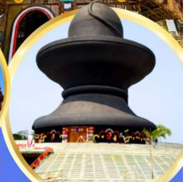
วัมมหาฤตยูชัย