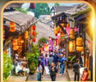
หมู่บ้านโบราณฉือชี่ฮั่ว