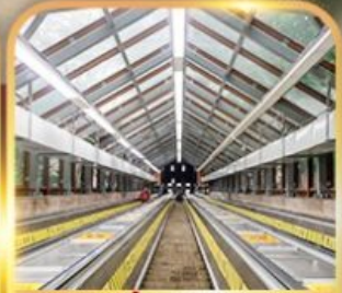
บันไดเลื่อนหวงกวน