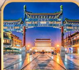
ถนนเจียนเหมิน