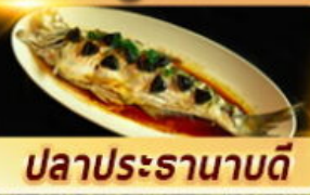
ปลาประรานาดี