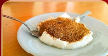
โยเกิร์ตผืน