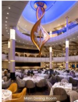
Main Dining Room