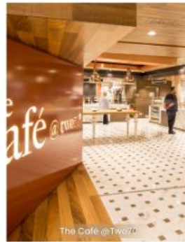
The Cafe @ Two70