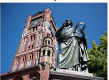
เมืองโตรุน