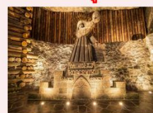
เหมืองเกลืออิลิชก้า