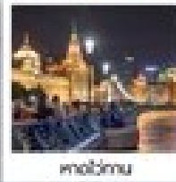
เมืองโบราณ