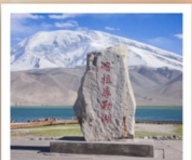
ทะเลสาบกาลาคู่เล่อ