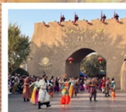
เมืองโบราณคัชการ์