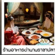
ร้านอาหารตำนานราชาปลา

เขาวตาร • ฟ่งหวง • ฟูหรงเจิน • ดางซา ล่องเรือลำน้ำถิวเจียงชมเมืองฟ่งหวงยามค่ำคืน / สะพานสายรุ้ง / เมืองโบราณฟ่งหวง น้ำตกฟูหรงเจิน / เขาคิยงเหินชาน / ระเบิดยงเกี้ยว / ประตูสวรรค์ / ไข่วางจิงจอกขาว ตึก 72 ชั้น / แกรนด์แคนยอน / สะพานแก้ว / เขาวตาร / สวนจอมพลเอ่อหลง ห้างวินเทอโฮยว / ซุปปิ้งร้านขนมยักษ์ / ถนนหวงซิงลู่ (POP MART)