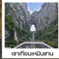
เขาคิยงเหินชาน

พิเศษ!!...รอบค่ำเช้าชุดพื้นเมืองที่ฟ่งหวง • รอบค่ำช่างถ่ายรูป น้ำตกฟูหรง