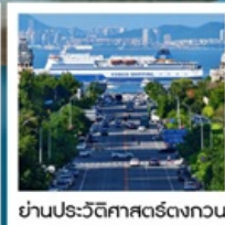
ย่านประวัติศาสตร์ตงกวน

Fisherman's Wharf • จัตุรัสซิงไห่ (รวมรถราง) • ถนนตงกวน • เวนิสแห่งต้าเหลียน • ถนนรัสเซีย