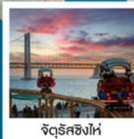
จัตุรัสซิงไห่