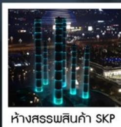
ห้างสรรพสินค้า SKP