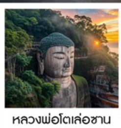
หลวงพ่อโตเล่อซาน