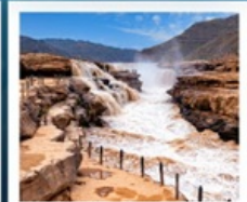
น้ำตกหูซัว