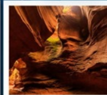
แกรนด์แคนยอนยูดาโกว