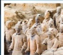
พิพิธภัณฑ์กองทัพใต้ดิน

พิพิธภัณฑ์กองทัพใต้ดินทหารม้าจีน (รวมรถแบตเตอรี่)