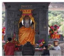
ไต้่องกง