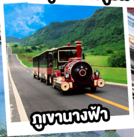
ภูเขาฉางฟ้า