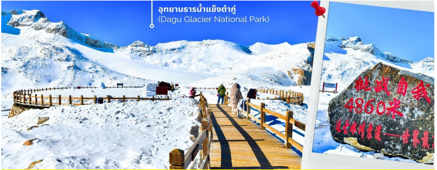
การตกและความหนาวของหิมะขึ้นอยู่กับสภาพอากาศ

จากนั้นนำท่านเดินทางสู่ เมืองเฮยลู่ (ใช้เวลาเดินทางประมาณ 2 ชั่วโมง) เพื่อเดินทางไปยัง อุทยานธารน้ำแข็งต้ากู่ปิงชวน(รวมกระเช้าขึ้นลง) ต้ากู่ปิงชวน หรือ Dagu Glacier National Park เป็นธารน้ำแข็งกลาเซียร์ที่สวยงามที่สุดแห่งหนึ่งของโลก และเป็นสถานที่ท่องเที่ยวระดับ 4A ของจีน ตั้งอยู่ที่เมืองเฮยลู่ ในมณฑลเสฉวน ห่างจากเมืองเฉิงตูประมาณ 300 กิโลเมตร ถือเป็นธารน้ำแข็งที่อายุน้อยที่สุด ที่ตั้งอยู่ในระดับความสูงที่ต่ำที่สุด และอยู่ใกล้กับเมืองมากที่สุดในบรรดาธารน้ำแข็งทั้งหมด โดยอยู่สูงจากระดับน้ำทะเลประมาณ 3,800-5,100 เมตร จุดสูงที่สุดที่นักท่องเที่ยวสามารถขึ้นไปได้จะอยู่ที่ 4,860 เมตร