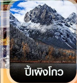
ปี๋เผิงโกว

✈️ คอนเฟิร์มออกเดินทาง ทุกพีเรียด 2 ท่านขึ้นไป