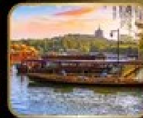
ล่องเรือ ทะเลสาบฉู