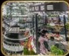
ภัตตาคาร เริ่มต้น WAREHOUSE NO.3