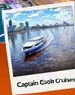
Captain Cook Cruises