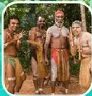
Rainforestation Aboriginal Show