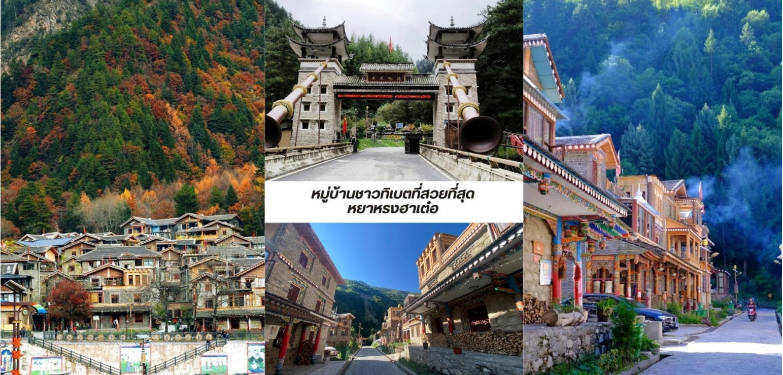
หมู่บ้านชาวกิเบตที่สวยงามที่สุด หย่าหงฮาเต๋อ

บ่าย นำท่านชม หมู่บ้านชาวกิเบตที่สวยงามที่สุด หย่าหงฮาเต๋อ (Yangrong Hades, 羊茸哈德) หมู่บ้านแห่งนี้เคยเป็นหมู่บ้านยากจนบนภูเขา แต่ด้วยการย้ายถิ่นฐานและพัฒนาการท่องเที่ยว ทำให้กลายเป็นจุดหมายปลายทางที่ดึงดูดนักท่องเที่ยวจากทั่วโลก ทัศนียภาพอันงดงาม หย่าหงฮาเต๋อล้อมรอบด้วยภูเขาสูง มีแม่น้ำเฮย์ส่วย (黑水河) ไหลผ่าน และป่าไม้เขียวชอุ่มตลอดปี โดยเฉพาะในฤดูใบไม้ร่วง ป่าไม้จะเปลี่ยนเป็นสีส้มสดใสของใบไม้เปลี่ยนสี ทำให้ทั้งหมู่บ้านดูเหมือนอยู่ในภาพวาดอันงดงาม หมู่บ้านนี้ยังคงรักษาเอกลักษณ์วัฒนธรรมกิเบตดั้งเดิม ทั้งการแต่งกาย อาหารท้องถิ่น และพิธีกรรมทางศาสนา หย่าหงฮาเต๋อ ไม่เพียงแต่เป็นสถานที่ท่องเที่ยวที่สวยงาม เท่านั้น แต่ยังเป็นหมู่บ้านที่สะท้อนให้เห็นถึงการพัฒนาจากความยากจนสู่ความมั่งคั่งผ่านการผสมผสานการอนุรักษ์วัฒนธรรมดั้งเดิมกับการท่องเที่ยวได้อย่างลงตัว