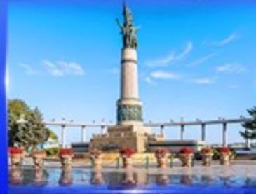
อนุสาวรีย์นิ่มหง