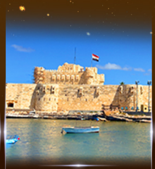
บ่อนประหาร Quite Bay