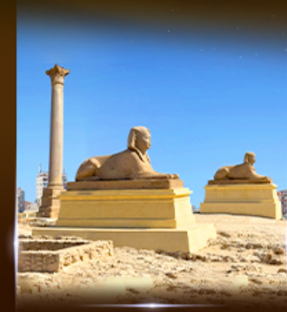
เสารัมปองเมย์