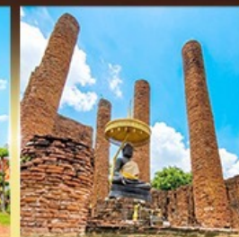
วัดธรรมิกราช