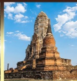
วัดราชบูรณะ