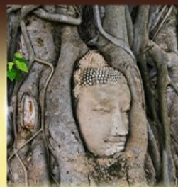
วัดมหาธาตุ