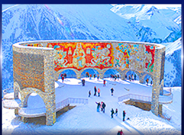
อนุสาวรีย์มิตรภาพ รัสเซีย-จอร์เจีย