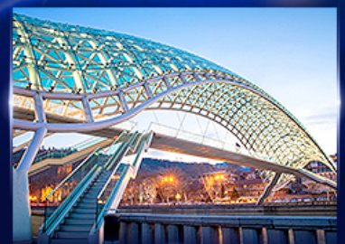
สะพานแห่งสันติภาพ ทบิลีซี