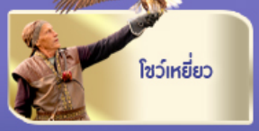
โซว์เหยี่ยว