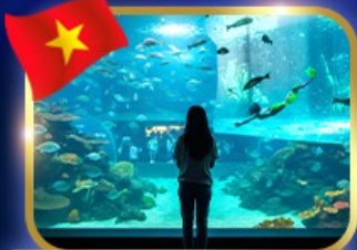
The Sea Shell Aquarium