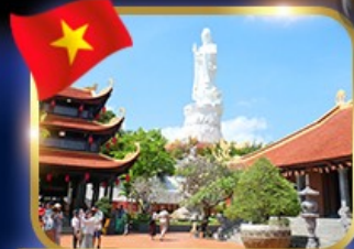
ขอพรองค์กวนอิม วัดโยก๊วก