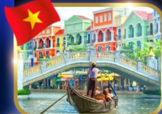
เวนิสจำลอง แกรนด์ เวิลด์