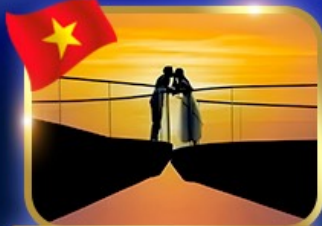
เช็คนินฮวน สะพานรูป