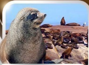
ล่องเรือชมฝูงแมวน้ำ ณ Seal Island

ทะเลทรายซาฟารี อุทยานสัตว์ป่าหุบเขาพิลานเบิร์ก