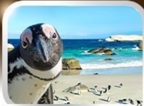
Simon's Town ชมนกเพนกวินสุดน่ารัก