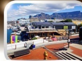
ช้อปปิ้งท่าเรือแบรนด์ชั้นนำ V&A waterfront