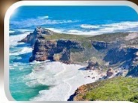
ชมวิวยุคปลายสุดแอฟริกา cape of good hope