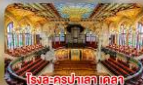
โรงละครปาลาเดอเดลา มูสิคก้า คาตาลานา