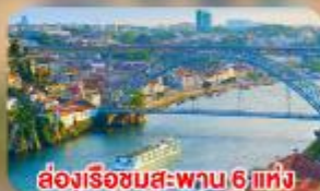
ส่องเรือชมสะพาน 6 แห่ง ในคูเมืองปอร์โต