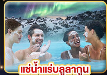
แช่น้ำแร่ลูลาทูน