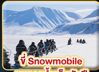
ขี่ Snowmobile บนธารน้ำแข็งพันปี