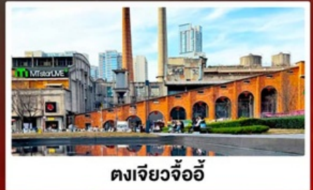
ตงเจียวจ้ออ๊