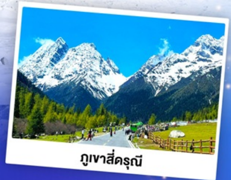
กุเวาสีดรุณี