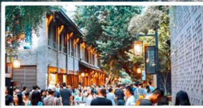
ถนนชอยกวั่งชอยแคว