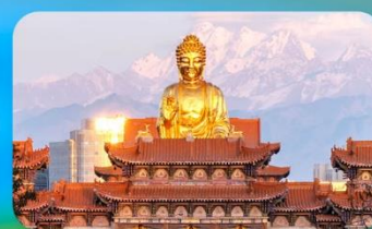
วัดพระใหญ่หวงกงชาน