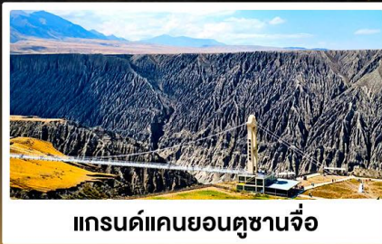
แกรนด์แคนยอนตูชานจื่อ