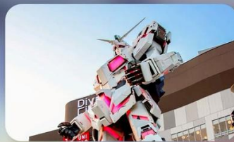
ช้อปปิงโอไดบะ