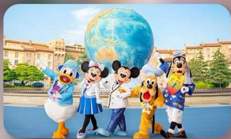
อิสระตามอริยาศัย 2 วัน