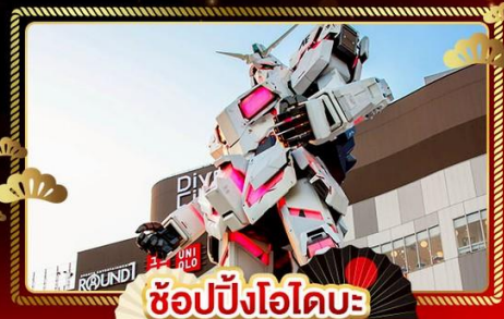
ช้อปปิงโอไดบะ