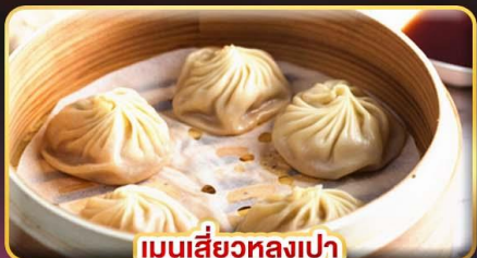
เมนูเสี่ยวหลงเปา