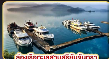
ล่องเรือทะเลสาบสุริยอันจินตรา