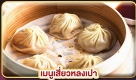
เมนูเสี่ยวหลงเปา