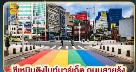
ซีเหมินติงไนท์มาร์เก็ต ถนนสายรุ้ง