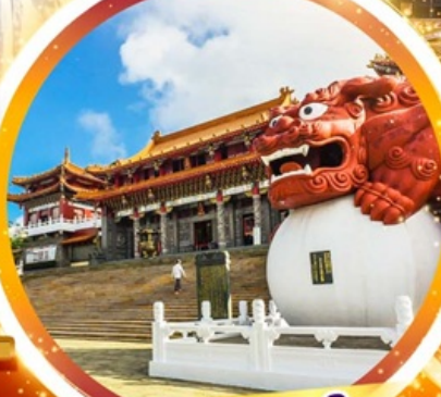
วัดหวินหฺวู