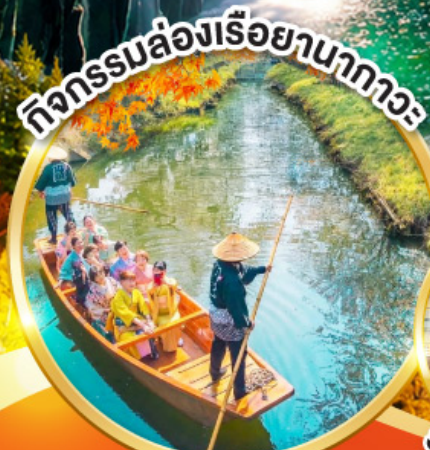
กิจกรรมล่องเรือยามากาวะ