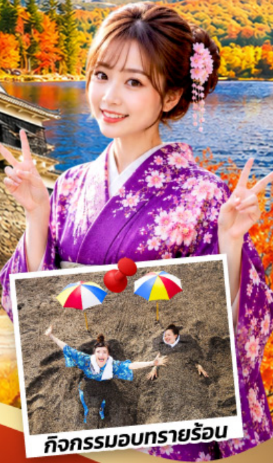
กิจกรรมอบทรายร้อน

สนุกกับกิจกรรม อบรมทรายร้อน นั่งเฟอร์รี่สู่เกาะซากุระจิมะ นั่งรถไฟชินคันเซ็นจากเมืองคาโกชิม่าสู่เมืองฟุกุโอกะ