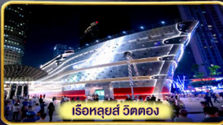
เรือหลุยส์ วิตตอง