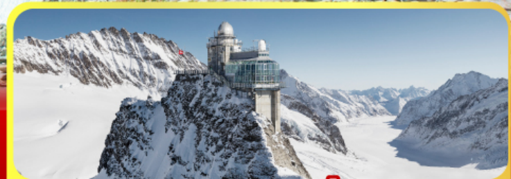
ยอดเทวาลุงเฟร่า